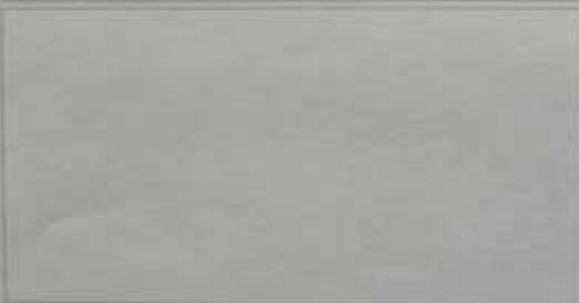
F1. Pavimento antiguo